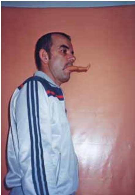
Dans la bouche - 1995