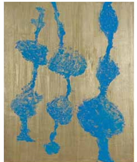
Identification absurde n°3 - 2009