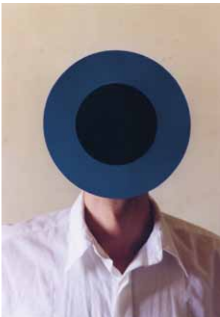
Homme cible - 1999