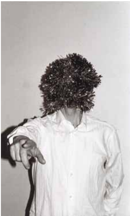
Le président merveilleux - 2011