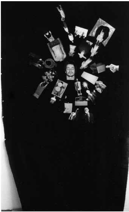
Drapeau - 2011