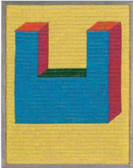
Identification absurde n°15 - 2009