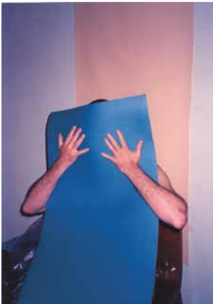
Ecran bleu - 1994