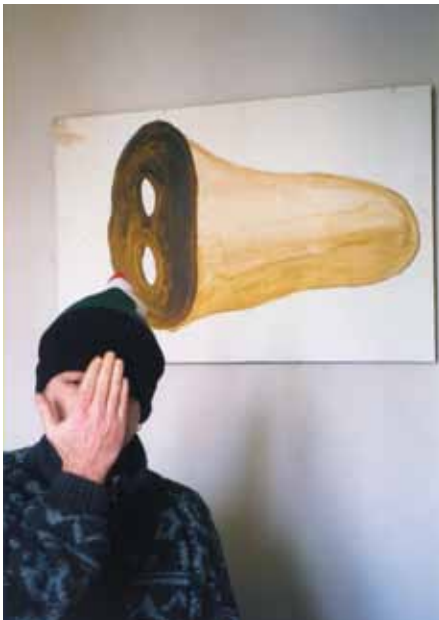
Attraction picturale - 1999