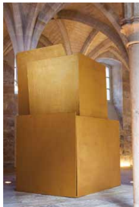
Le chef d'œuvre - 2011