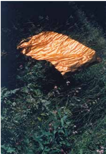
Sans titre (le calme) - 2009