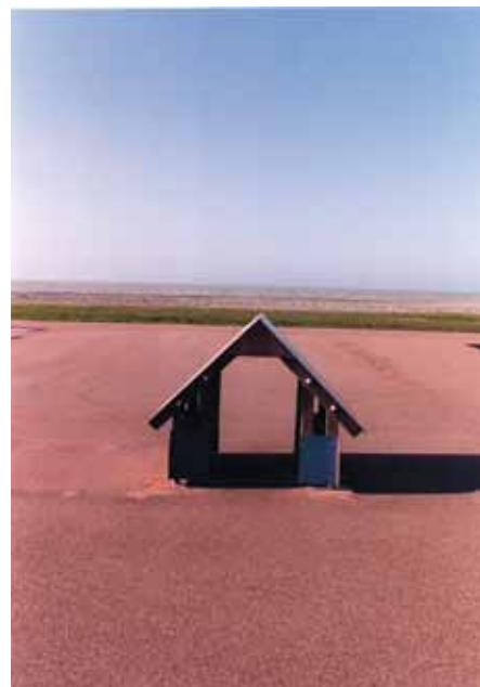
Maison en bois et goudron - 2001