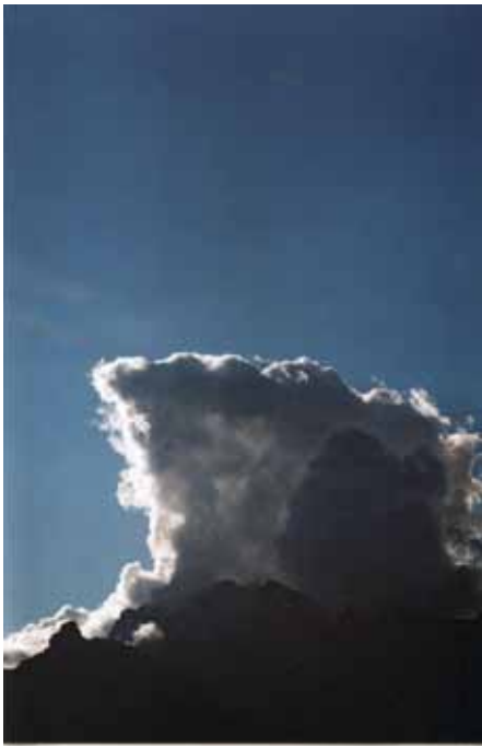
Construction ideale - 2010