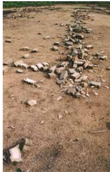
Archéologie hasardeuse - 2007