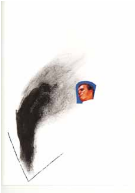
Actualités n°6 - 2010

JMA - Une autre singularité est la proximité entre tes photographies et tes vidéos. Et la dernière vidéo est consacrée à l'une de tes installations les plus connues, Mon Chef d'œuvre . Qu'est-ce qui t'a amené à la vidéo et comment penses-tu l'articulation avec le reste de ton travail ?