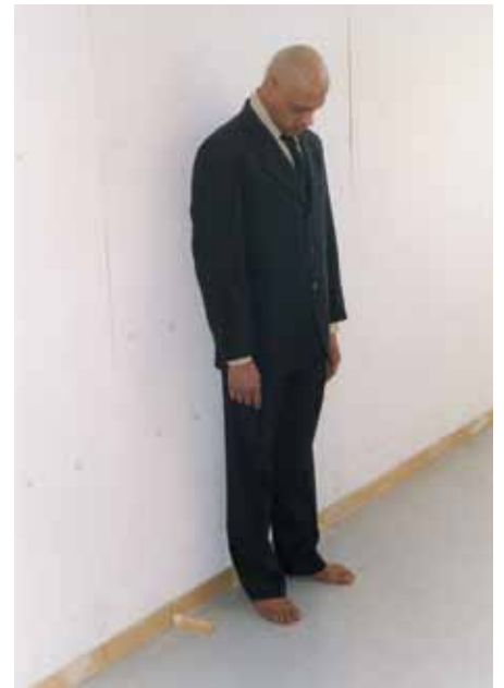
Dormant - 2008