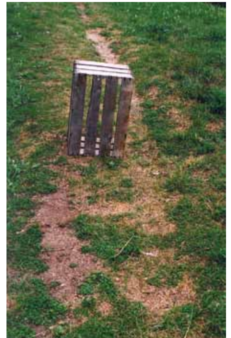
Seule - 2010