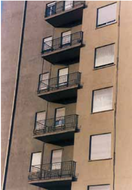
Territoire de l'abstraction - 2001