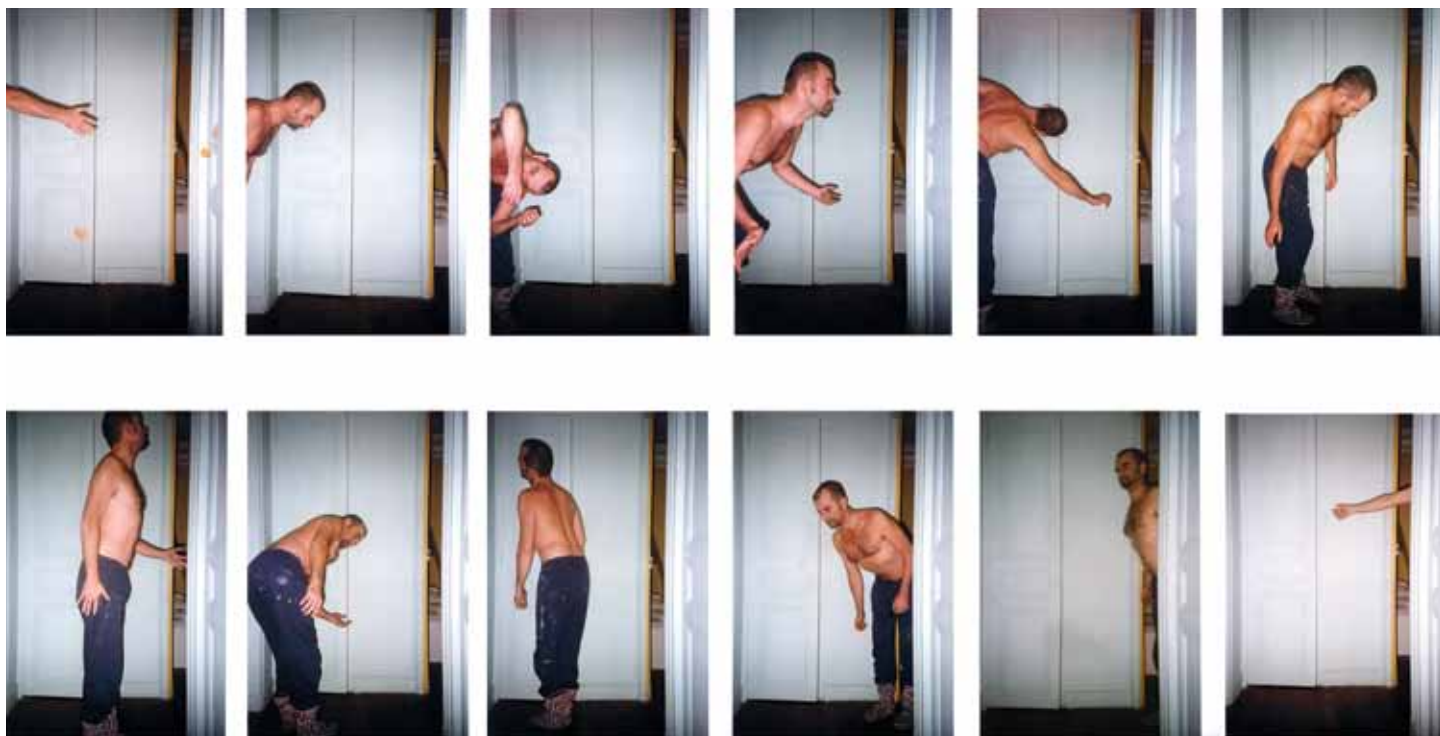
Le couloir - 1995

GTS - This space, if that's actually what it is, is totally virtual. It's a territory because it belongs to me, it's a matter of my personal culture, which has been built up out of experiences, encounters, climates and everything journeying involves. Among the forms of order no single one dominates, even if some of them hinge on and ensure the special character deriving from freedom of invention. It's a question of exchanges that produce precipitates, as in chemistry, and often out of the perpetual motion of chance. This means removing the point of view from the Art mechanism, in comparison with DADA's declaration of blind freedom rooted in the thrust of the contemporary and its enduring effects. It's a matter of a possible elsewhere within the world of the real.