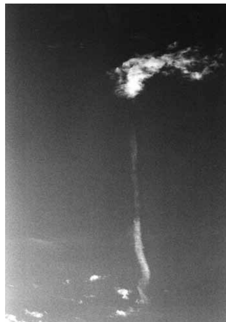
Nuage n/b 24 - 2011