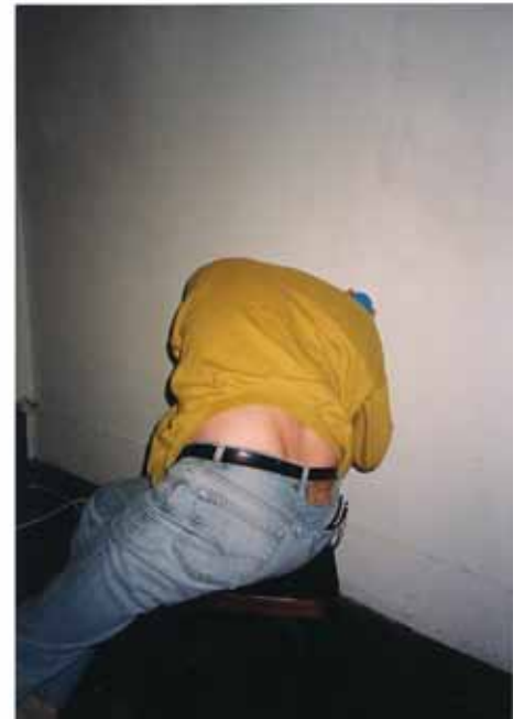
Jeu avec deux balles bleues - 1996

JMA - Une très belle série de dessins est intitulée «Projets improbables». Chacun présente une possibilité d'installation, de sculpture, tout en restant un dessin où l'aléatoire semble la règle. Ces deux notions d'aléatoire et d'improbable courent dans toute ton œuvre comme deux contraires. Peux-tu nous éclairer ?