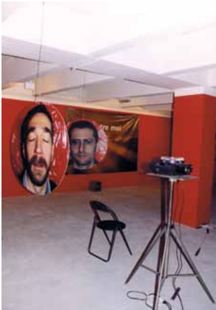
Exposition - 1998

JMA - Je me souviens que mes premières remarques sur ton travail, tant photographique, vidéo que pictural, portaient sur la circulation de choses et d'objets entre les œuvres. Elles m'apparaissaient à l'époque comme de possibles éléments d'un langage. Peux-tu nous expliquer le lien entre objets et choses ? Et comment penses-tu le lien de ton travail au langage ?