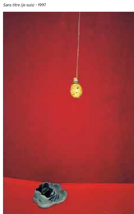
Sans titre (je suis) - 1997